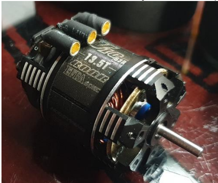
3.5mm Buchsen/ prises femelles 3.5mm / prese 3.5mm

F1 / TC ProStock / TC SuperStock (symbolisches Bild / Image symbolique / immagine simbolica)